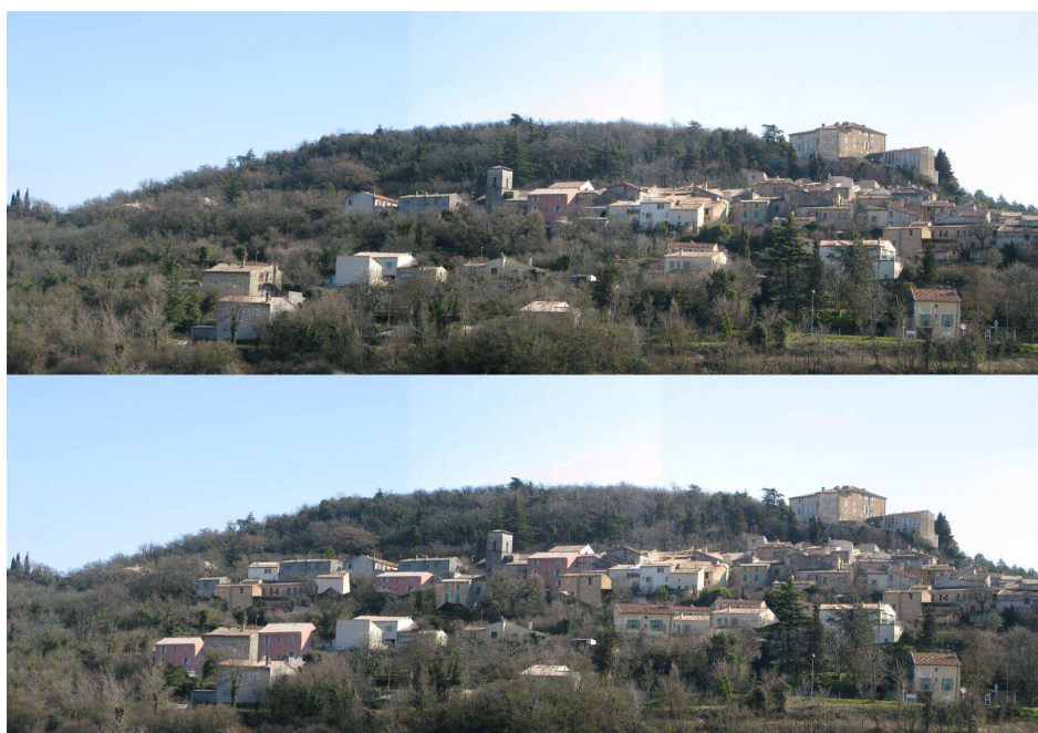
Exemple de photomontage d'intégration de constructions dans le tissu urbain du village d'Esparron (83) (28)

Les actions et opérations nécessaires pour permettre le renouvellement urbain pourront, quant à elles, être présentées dans les OAP du PLU, à travers un schéma d'aménagement. Les OAP peuvent être agrémentées par ailleurs, de photomontages simulant les implantations de nouveaux bâtis au sein du tissu urbain existant ( Voir exemple ci-après ). L'intégration et la perception paysagères sont ainsi mesurées virtuellement.